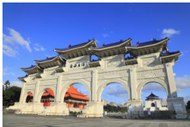
(中正記念堂イメージ)